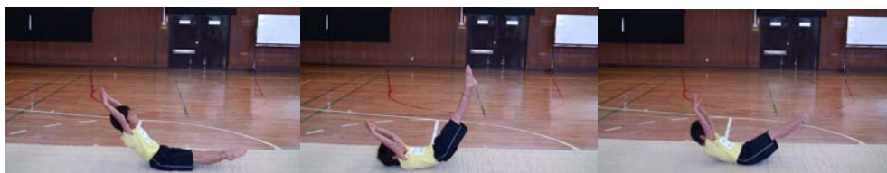
図 11 (a) (b) (c)

<ねらい>かかえ込み又は伸身の体勢で、上体と下肢の動きが連動する感覚をつかむ。 <やり方>まず、かかえ込み体勢で座り、上体を後ろにゆっくり倒しながら下肢を引きつける。次いで下肢を下ろしながら上体を引き上げる。この動きを繰り返す。 それができるようになったら、膝を伸ばし、腰をできるだけ伸ばし（体をふくむ程度）で同じようにゆりかご運動を行う。 足や頭が床に着く前に運動を切り返す。 <到達レベル>動きがスムーズにできるようにする。上体の倒しに連動して下肢が動く、また逆に下肢の動きにつられて上体が起き上がってくる感じがスムーズにできるようにする。