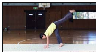
図 1 (b)