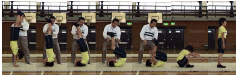
図 27 (a) (b) (c) (d) (e) (f) (g)