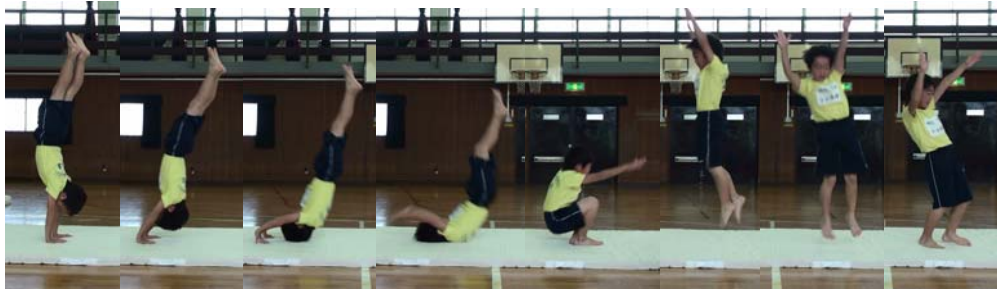
図 30 (a) (b) (c) (d) (e) (f) (g) (h)