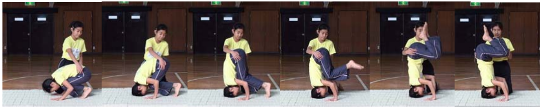
図21 (a) (b) (c) (d) (e) (f)