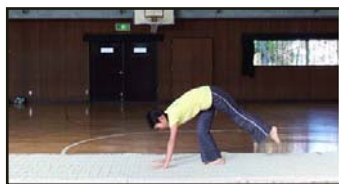
図 1 (a)